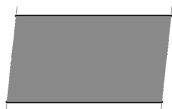
Aanduiding van een oversteeklijn in dit document.